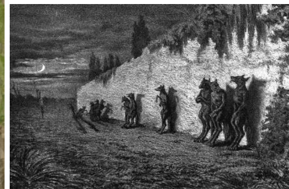
Maurice Sand (1823-1889), Illustration d'une légende rustique « Les lupins » , Musée George Sand, La Châtre

Les visuels sont disponibles sur demande pour la presse.