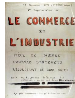
Maurice Sand (1823-1889), Affiche du théâtre de Nohant , Musée George Sand, La Châtre