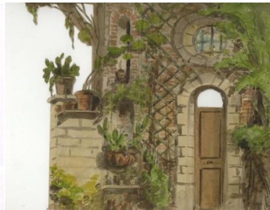
Maurice Sand (1823-1889), Maquette pour un décor de théâtre de Nohant , Musée George Sand, La Châtre