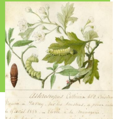
Maurice Sand (1823-1889), planche d'entomologie, collection particulière