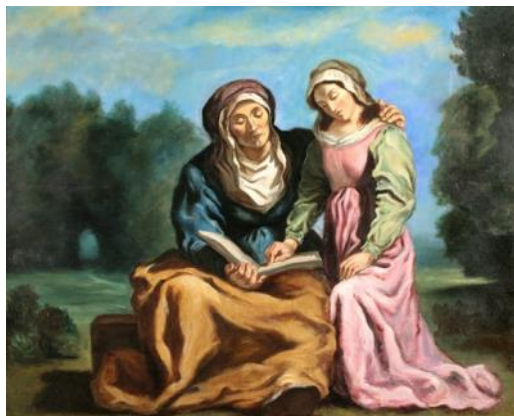
Maurice Sand (1823-1889), L'éducation de la Vierge , Dépôt de la commune de Nohant-Vic (classé MH) au Musée George Sand, La Châtre