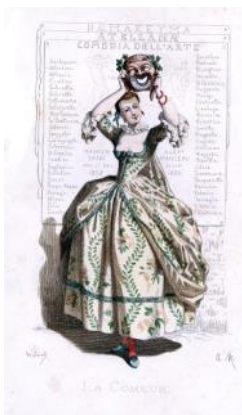
Maurice Sand (1823-1889), personnages de Masques et Bouffons , Collection particulière