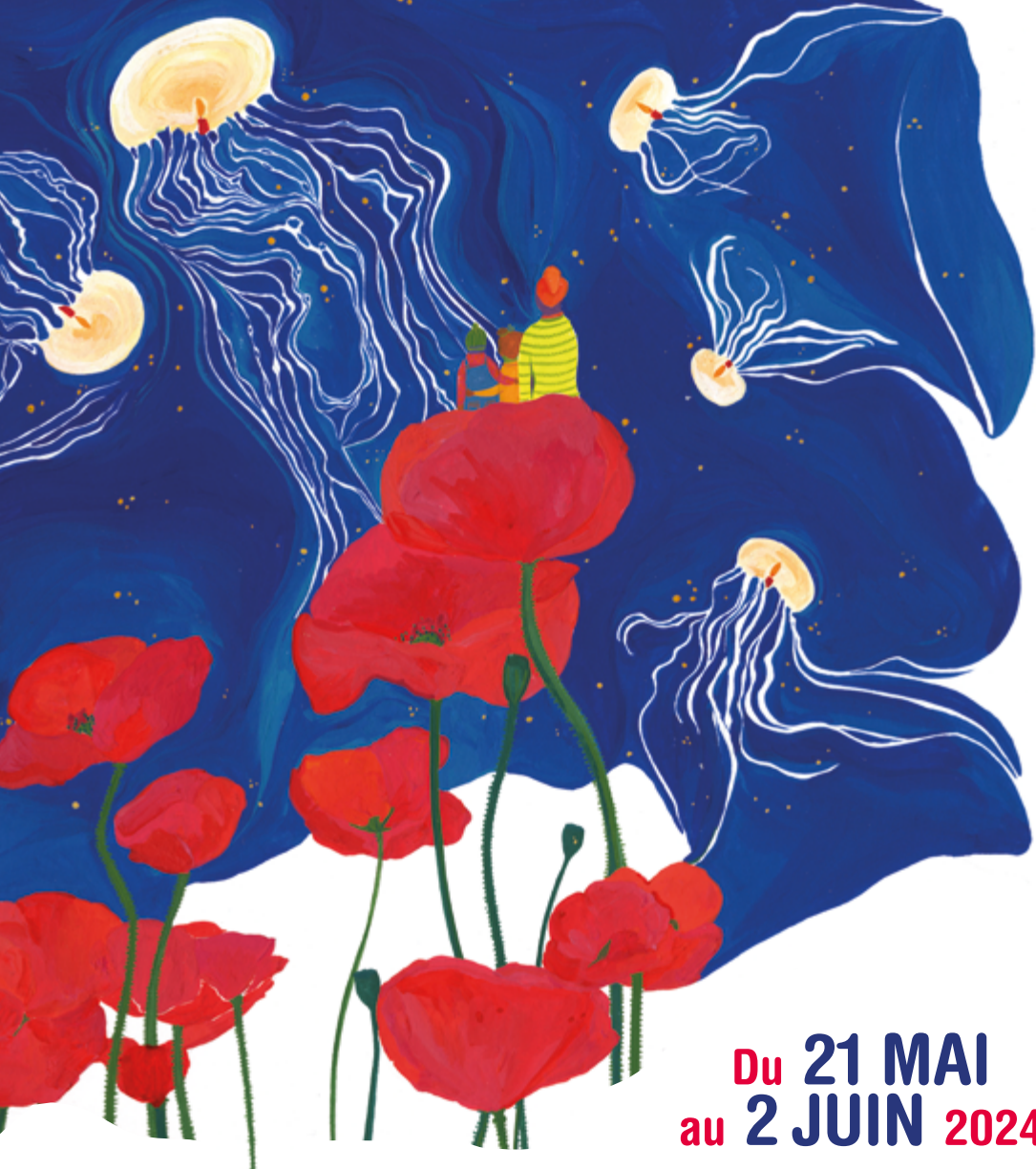
Illustration : Mathilde JOLY / Conception : Service Communication CD23