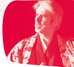
Pascal FAULIOT ©Heartemix